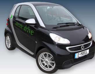
Elektroautos können Solarstrom wirtschaftlich speichern und machen so umweltfreundlich mobil.