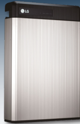
Batteriespeicher ermöglichen den Verbrauch von Solarstrom auch am Abend und in der Nacht.